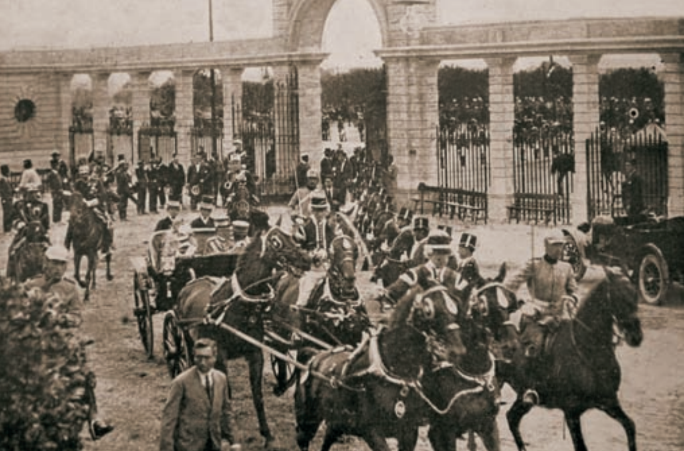
Dragones del Numancia escoltando a los reyes Alfonso y Victoria en Barcelona, en 1923.