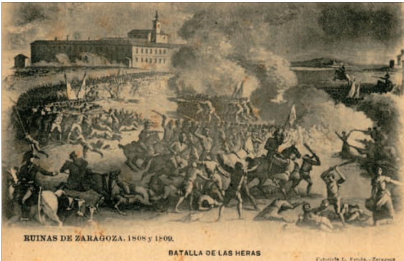
Juan Gálvez y Francisco Brámbila "Batalla de las Heras" Aguafuerte y aguatinta, 410 mm. x 620 mm. 1808 y 1813. Real y Excma. Sociedad Económica de Amigos del País.

U N amigo navarro me decía hace unas semanas que le llamaba mucho la atención el interés y el orgullo de los zaragozanos por lo que sus antepasados habían hecho durante Los Sitios. Lo que demostraba con esa afirmación era su desconocimiento de la desidia, y en algunos casos hasta menosprecio, que nuestra ciudadanía muestra hacia el que quizá sea el episodio más importante de la historia de Zaragoza. No en vano, el propio Napoleón llegó a decir que "aquella desdichada guerra de España me perdió" y uno de los puntos principales de la resistencia contra el dominador de Europa fue nuestra ciudad.