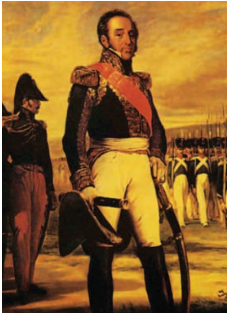
"Mariscal Louis Gabriel Suchet." Jean Baptiste Guérin. Museo de Versailles

La División Areizaga, como hemos indicado, se quedó en la retaguardia en Botorrita y Planas de María, dominando Botorrita con 6.500 hombres y ocho pie-