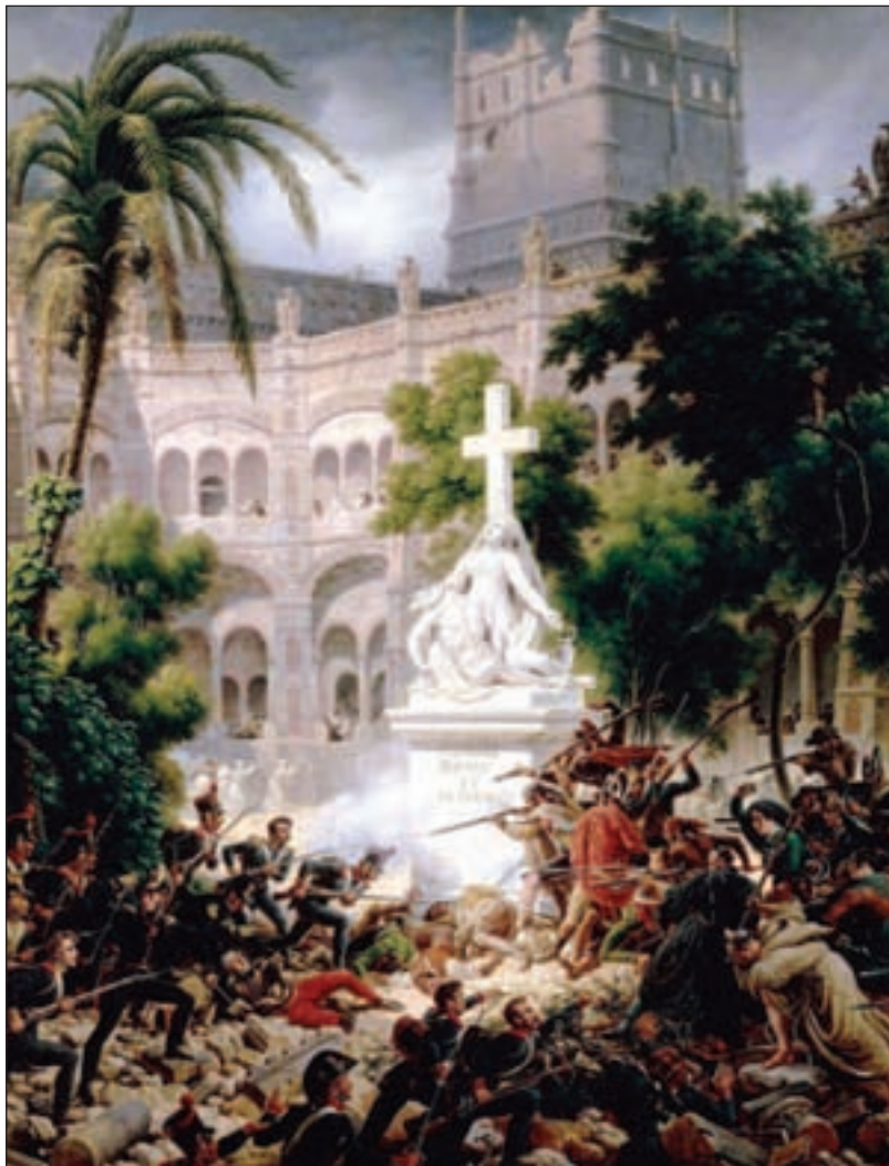
"Asalto al Monasterio de Santa Engracia." Louis François Lejeune. Musée National du Château de Versailles.

María debería trabajar para que en el 2008, fecha en que se van a preparar eventos internacionales sobre la Guerra de la Independencia y los Sitios de Zaragoza, participe con una exposición que finalice constituyéndose en sala permanente de la batalla de María tal y como tienen Waterloo o Austerlitz y que supusiera un orgullo para la localidad. Celebrar una conmemoración de la citada batalla tal y como hacen en toda Europa sería un objetivo complementario y realista que sin duda encontraría el eco necesario.