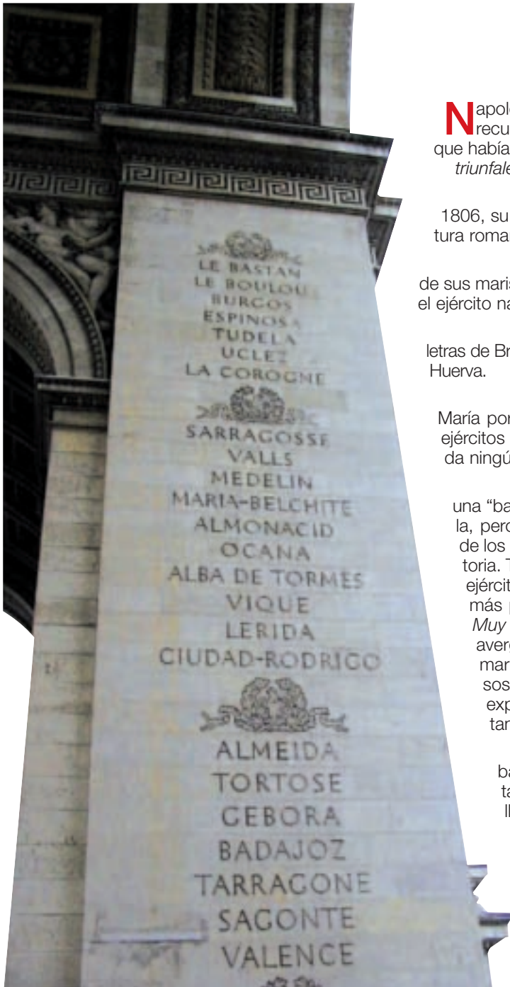
Bajorelieve en el Arco de Triunfo de París, con los recuerdos a las batallas de Zaragoza, María de Huerva y Belchite, entre otras victorias napoleónicas en España.

En esta fecha el ejército español de la zona de Levante y el Francés del Norte se enfrentaron en el término municipal de María. El paisaje en el que se desarrollaron los acontecimientos ha sido el que