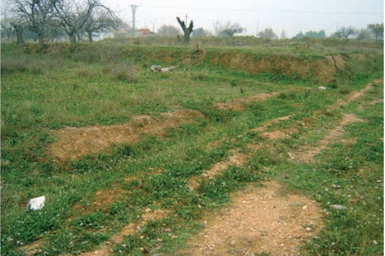
Emplazamiento de la posición defensiva durante el primer Sitio de Zaragoza en el puente de La Muela. JOSÉ ANTONIO PÉREZ FRANCÉS

La Muela y Casa de Paradas de Merenchel (se encontraba situada junto al Canal, en el Soto del Aeropuerto). A las nueve de la mañana aparecieron por el cajero del Canal ochenta soldados de caballería, y por la parte de las viñas venían haciendo fuego algunas guerrillas.