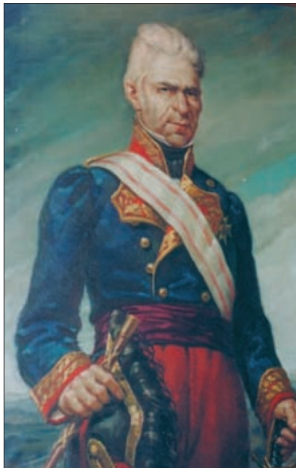
Uno de los más destacados defensores fue el teniente coronel Pedro Villacampa, al mando de los Voluntarios de Huesca. Cuadro de Alejandro Cañada, donado en 1947 por el Arma de Infantería a la Academia General Militar.

Gazan avanzó llevando en vanguardia al 10.º de Húsares, cuyos exploradores encontraron pronto a