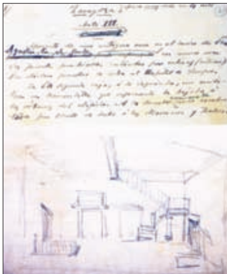
Bocetos de Galdós para la escenografía de los actos II y III de la opera Zaragoza. Casa-Museo Pérez Galdós de Las Palmas.