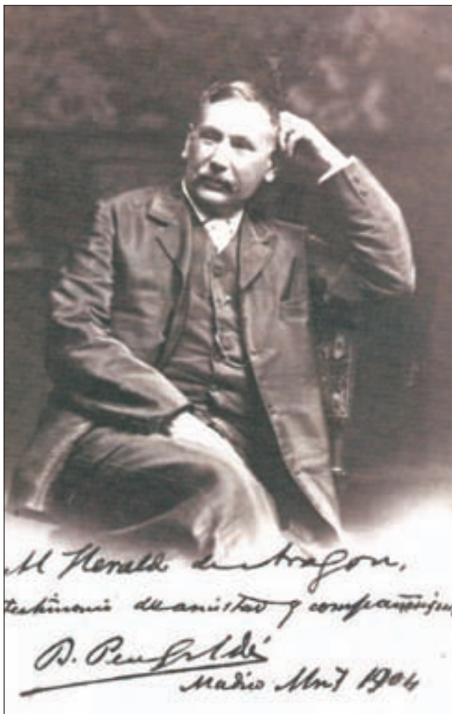
Retrato fotográfico de Benito Pérez Galdós dedicado al periódico Heraldo de Aragón en 1904.