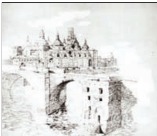
Arriba, la Puerta del Carmen de Zaragoza. Litografía realizada a partir de un dibujo original de Galdós (firmado con las iniciales entrelazadas PG en el ángulo inferior derecho), para el Episodio Nacional “Zaragoza” (Madrid, 1882, tomo III). El Pilar de Zaragoza. Dibujo original de Galdós para el Episodio Nacional “Zaragoza”. (Madrid, 1882; tomo III).