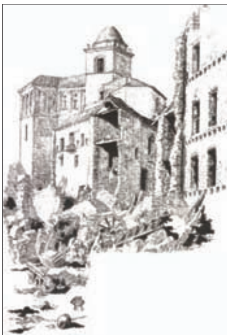
Restos del Monasterio de Santa Engracia según la reinterpretación hecha por Galdós del aguafuerte de Galvez y Brámbila, de la serie “Ruinas de Zaragoza”.

En la ópera, además, a lo largo del acto se va pasando de la oscuridad nocturna al amanecer, lo cual escenográficamente permitía un efectismo plástico notable. Las acotaciones van señalando la gradación de las luces desde la tinieblas a la claridad de la mañana con minucia. De este modo, Galdós, familiarizado con la famosa torre inclinada y con su ya larga tradición iconográfica, la aprovecha teatralmente. Y como ya hemos apuntado, aún fue más lejos en su propuesta y en el manuscrito dibuja él mismo un boceto escenográfico que facilite al escenógrafo la idea de lo que pretendía conseguir.