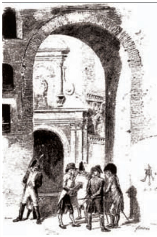
Dibujo original de Galdós, para el Episodio Nacional “Zaragoza”, (Madrid, 1882; tomo III).

“Galdós, al escribir para la escena Zaragoza, ha conseguido pintar de mano maestra los grandes rasgos que caracterizan nuestra capital durante los Sitios, poniendo sobre fondo patriótico, obligado en su concepción, las notas religio-