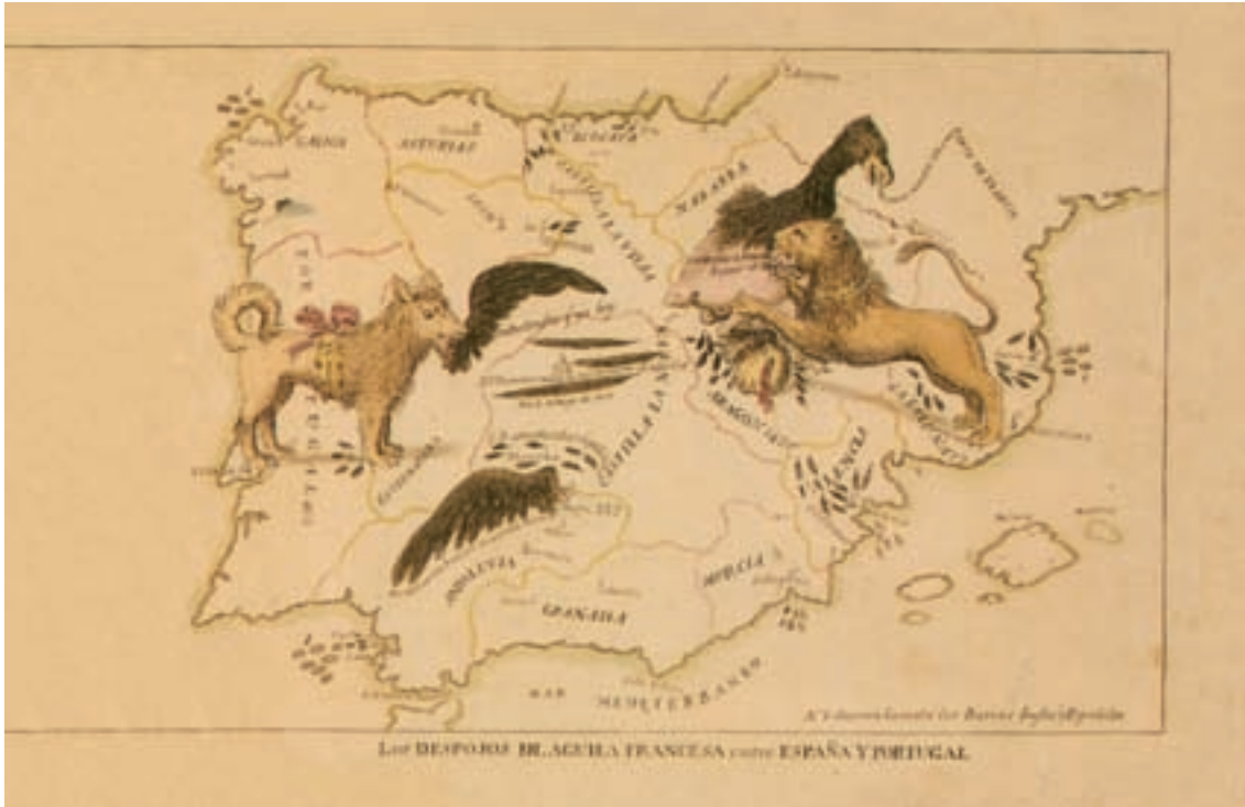
Los despojos del águila francesa entre España y Portugal. GRABADO COLOREADO. BIBLIOTECA NACIONAL. PRIMER TERCIO DEL SIGLO XIX.

gesta, y Pérez Galdós abriría su gran saga nacional con esta guerra, protagonizada por el pueblo, muy al estilo de lo que haría Tolstoi en Rusia.